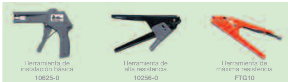
Herramienta de instalación básica 10625-0