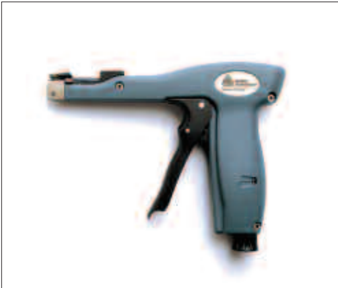
Herramienta manual para sujetacables 12001-0