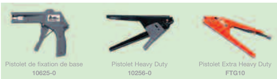
Pistolet de fixation de base 10625-0